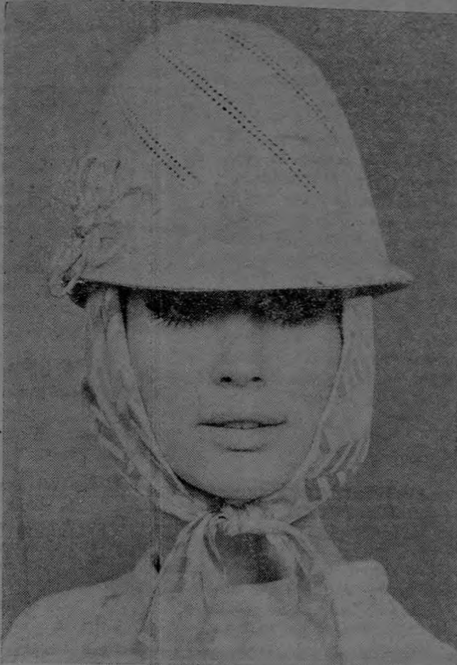
Colonia (INB). Campos de flores encima de las cabezas — no gustan a las mujeres de nuestros días. La moda sombrereril femenina para primavera y verano de 1969, llamada "Summertime", es sencilla y deportiva y rehuye los experimentos. Con fieltro blanco o paja se crearon sombreros casi masculinos que poseen solapas anchas o estrechas y q' hacia delante adoptan la forma de una sombrilla. Los colores predilectos: color pastel intenso, azul intenso, pardo o rojo. Si el viento fuese demasiado fuerte, habrá la posibilidad de sujetar el sombrero con un lazo multicolor de seda.